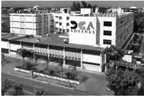
Dirección General de Aduanas (DGA)