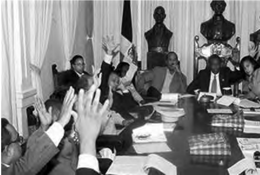
Sala Capitular del Ayuntamiento

Como puedes ver, en la ilustración se está realizando una sesión y en ella una votación. Esa sesión es la Sala Capitular conformada por el Presidente del Ayuntamiento, los Regidores y el Síndico Municipal.